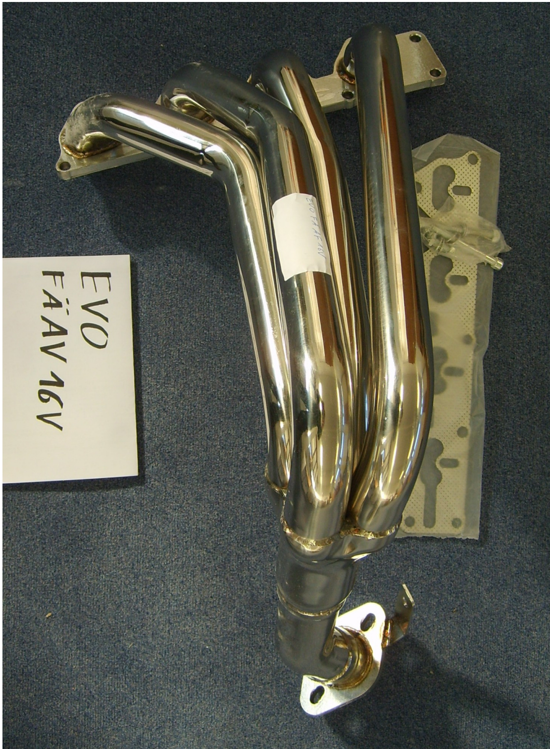
Auspuffkrümmer, Typ EVOFÄÄF16V