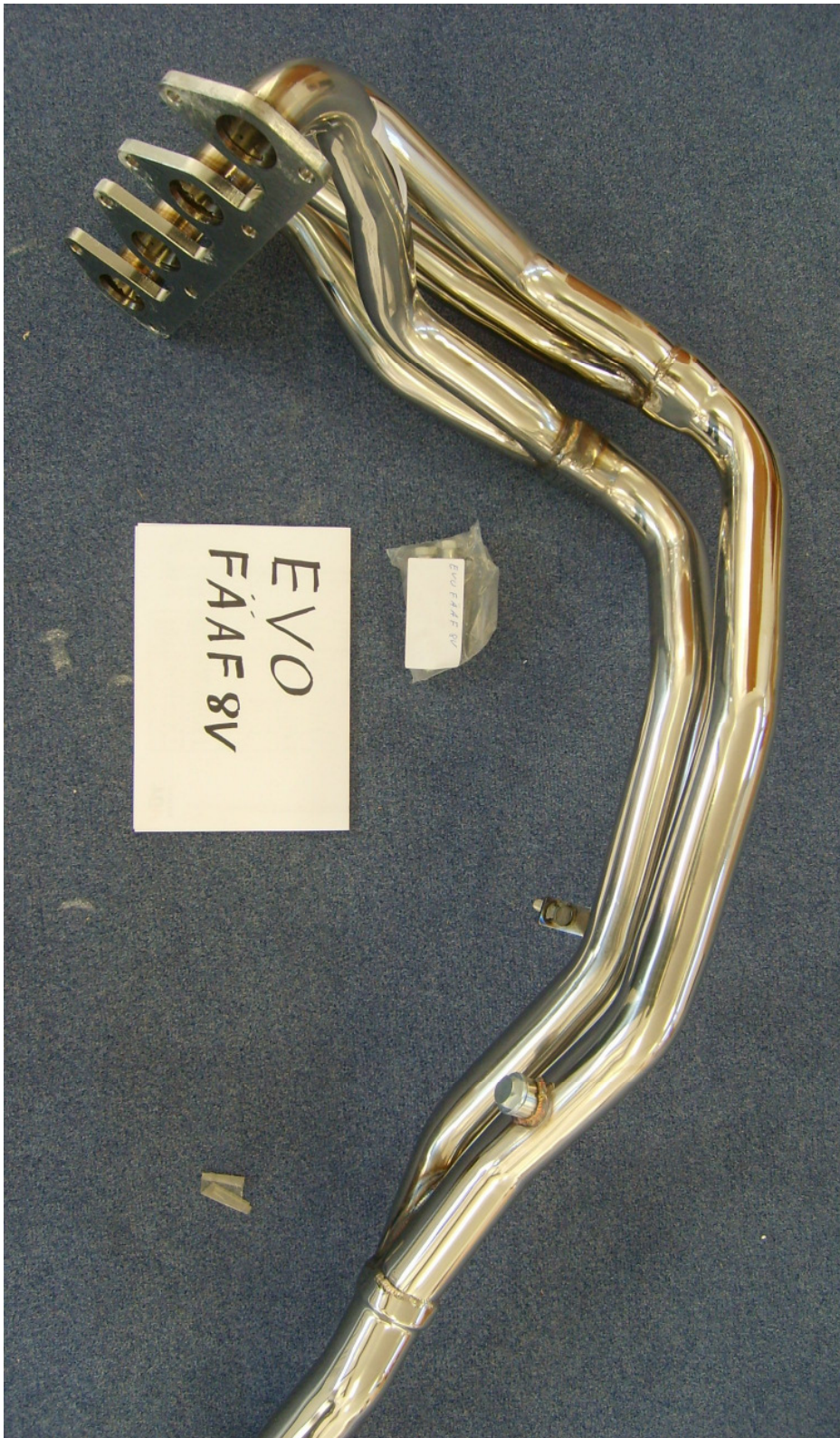
Auspuffkrümmer, Typ EVOFÄÄF8V