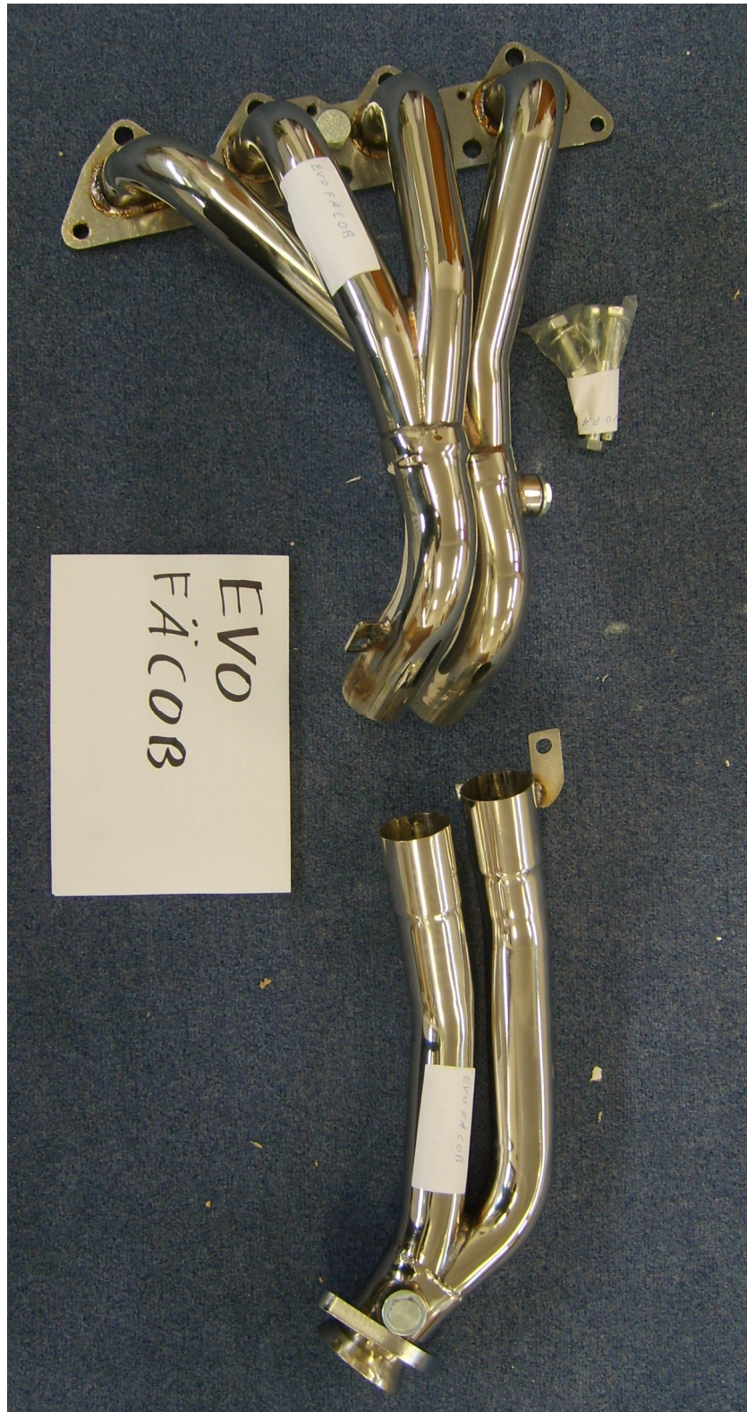
Auspuffkrümmer, Typ EVOFÄCÖB