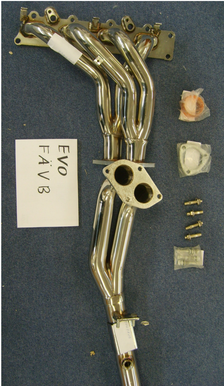
Auspuffkrümmer, Typ EVOFÄVB